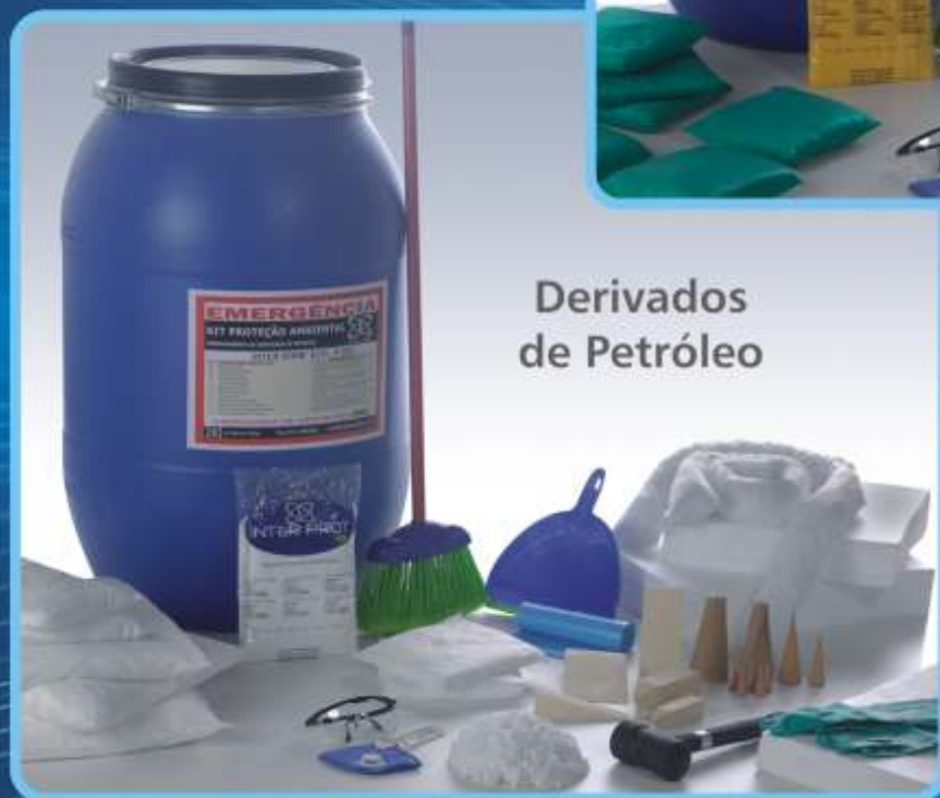
Derivados de Petróleo